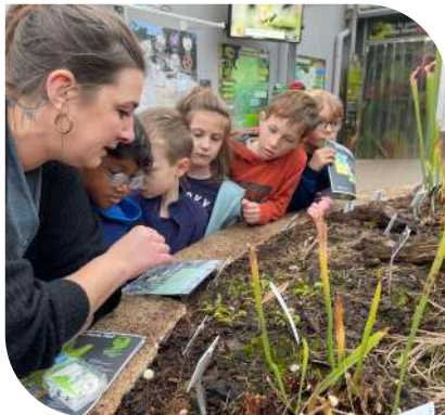
Sortie du club nature junior au Jardin Botanique