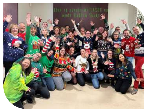
Pulls de Noël : élus et agents de Laxou ont répondu présents