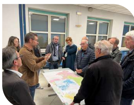
Présentation du PLUI HD