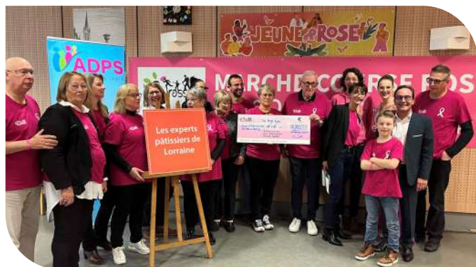
Remise du chèque de 6 000 € par les Fourasses à Parcours de Vie et Jeune et Rose