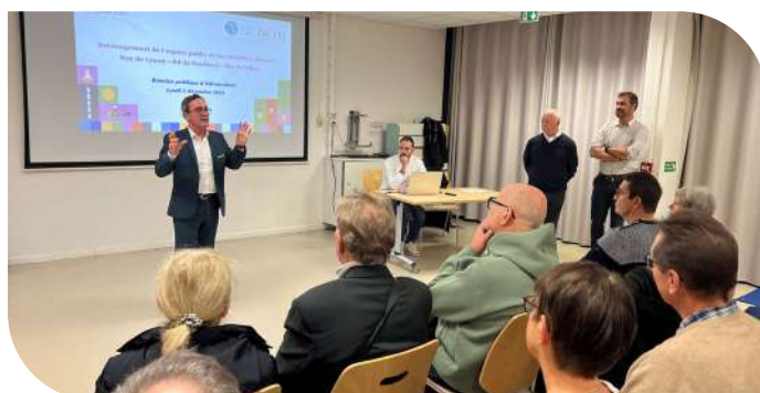
Réunion publique boulevard de Hardeval