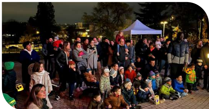
Fête des lanternes de la Saint-Martin