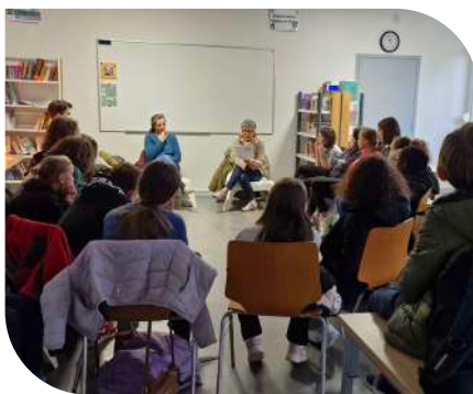
Atelier « contes » à la médiathèque