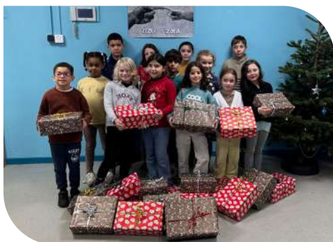
Cadeaux offerts par les enfants des écoles aux personnes en situation de précarité