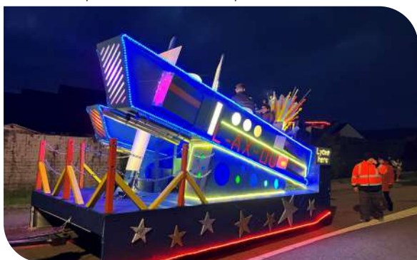
Char de la Saint Nicolas sur le thème du futur