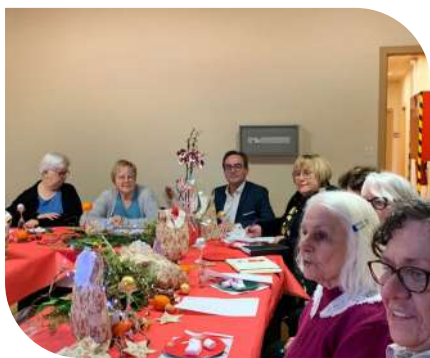
Assemblée générale de l'association des Dentelles Campoviennes