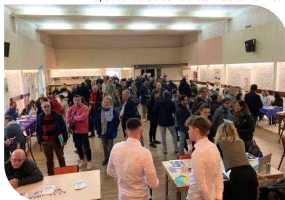
Forum emploi seniors salle Colin