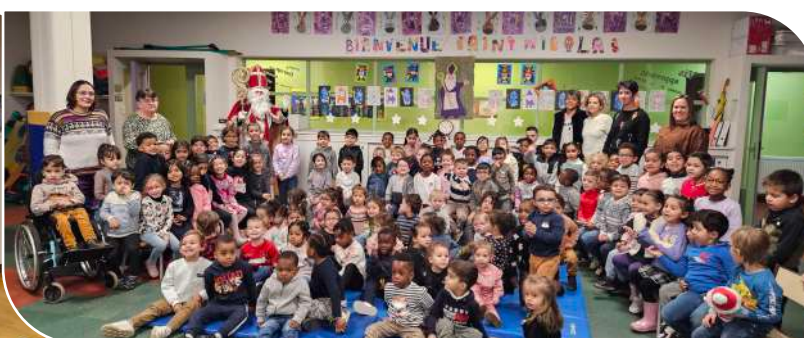
Distribution de chocolats par Saint Nicolas dans les écoles