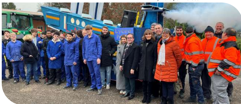
Présentation du char par les élèves du lycée Héré et les agents ayant collaboré à sa conception