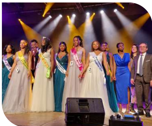
Élection de Miss Tropiques