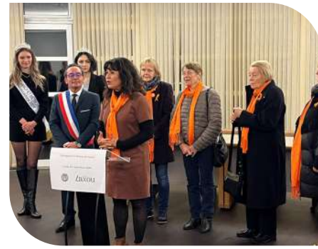
Orangeons la Mairie de Laxou - Opération contre les violences faites aux femmes