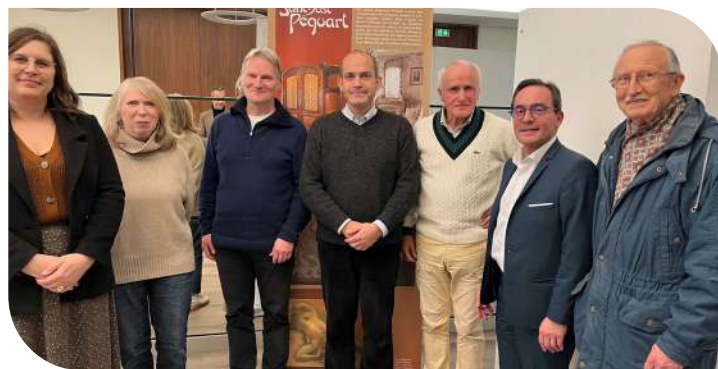
Exposition Saint-Just Péquart