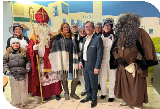
Fête de Saint Nicolas au Champ-le-Bœuf