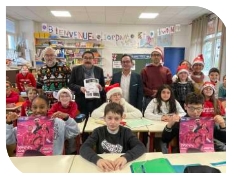
Remise de places pour le match de volley VNVB/Marcq-en-Baroeul