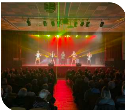
Spectacle de Noël offert aux seniors Laxoviens