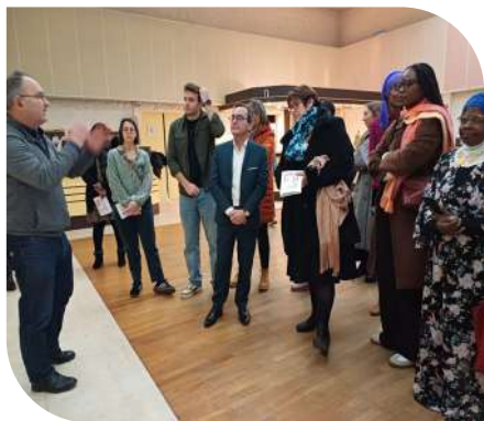
Opération parentalité avec le CCAS de Laxou