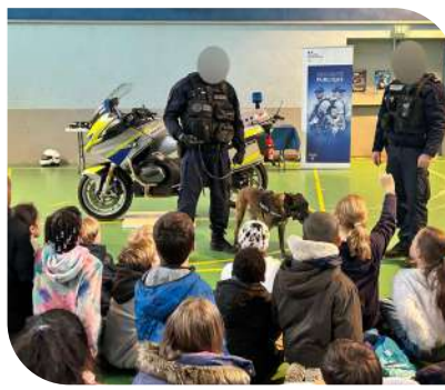
Intervention Police Nationale dans les écoles