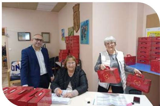
Distribution des colis de Noël aux seniors