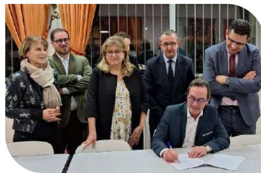
Renouvellement de la Cité Éducative du Plateau de Haye